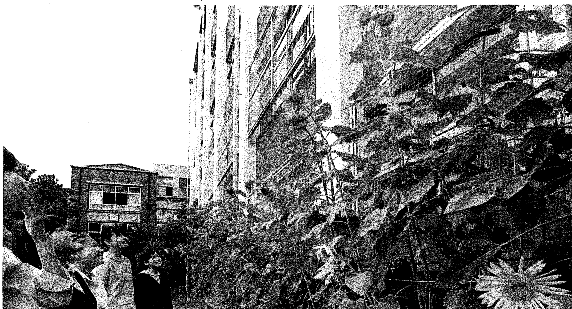
平安女学院中・高の校庭で大輪の花を咲かせたヒマワリ