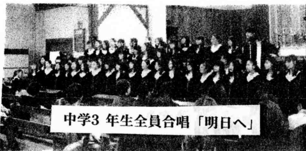
中学3年生全員合唱「明日へ」