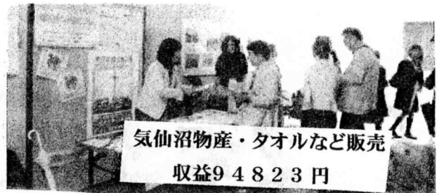
気仙沼物産・タオルなど販売 収益94823円